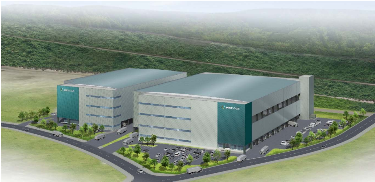
「プロロジスパーク神戸 4」完成イメージ(敷地内に 2 棟開発した場合のモデルプラン)

物流不動産の所有・運営・開発のリーディング・グローバル企業であるプロロジス(日本本社:東京都千代田区丸の内)は、このたび、兵庫県神戸市において「プロロジスパーク神戸 4」の開発を発表しました。「プロロジスパーク神戸 4」は、敷地内に特定企業専用(BTS 型)の賃貸用物流施設 2 棟の開発を想定し、入居企業を募集します。このたびの開発は、「プロロジスパーク神戸」「プロロジスパーク神戸 2」「プロロジスパーク神戸 3」に続いて「神戸テクノ・ロジスティクスパーク」内でのプロジェクトとなります。