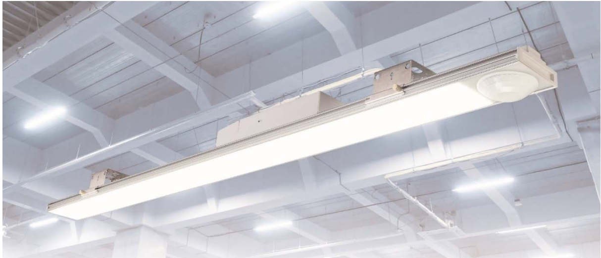
LED 照明「Lumiqs BL-640」

物流不動産の所有・運営・開発のリーディング・グローバル企業であるプロロジス（日本本社：東京都千代田区丸の内）は、このたび、物流施設・工場など高天井用の LED 照明について、赤外線センサーメーカーのアイキュージャパン株式会社（本社：滋賀県栗東市、以下アイキュージャパン）と共同開発を行ったことを発表しました。共同開発した製品は、プロロジスが運営する物流施設内で実証実験を実施済みで、アイキュージャパンが 5 月に発売を開始します。