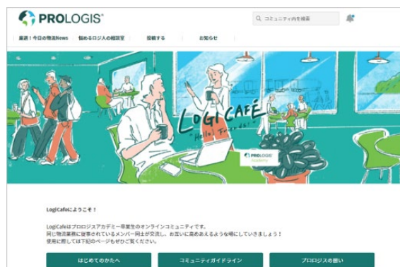
受講生・卒業生用コミュニティサイト